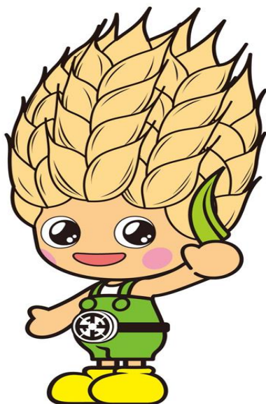
上里町マスコットキャラクター 「こむぎっち」